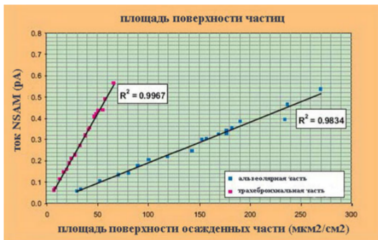
Площадь поверхности частиц, осевших в трахеобронхиальной и альвеолярной частях легких для эталонного работника, по отношению к току анализатора (ток NSAM)

Сигнал тока анализатора 3550 (установленный для отклика частей ТВ или А) хорошо соотносится с расчетным значением площади осевших частиц в соответствующей части легких.